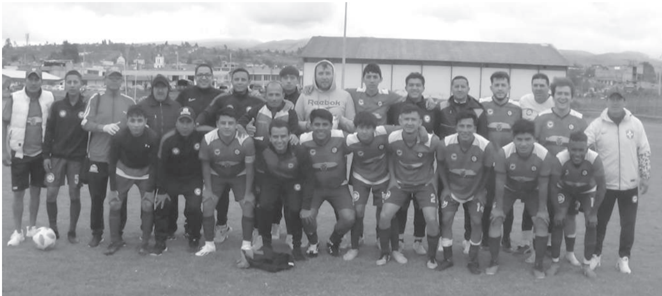
■ Defensor El Calvario en un cotejo reñido ganó en su vista a Solo Ramoncinos en San Buenaventura.

Al son de las bandas de pueblo que matizaban la “Mama Negra” en homenaje al “Doctor San Buenaventura”, Patrono de la Parroquia, se desarrollaba el único cotejo programado en el estadio del lugar entre: Solo Ramoncinos frente al Defensor El Calvario, que se daba por la tercera fecha del campeonato interligas de FEDELIBAPAL.