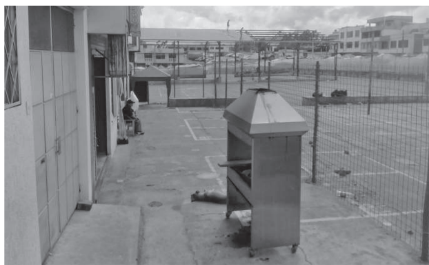
■ Plaza 18 de Octubre.