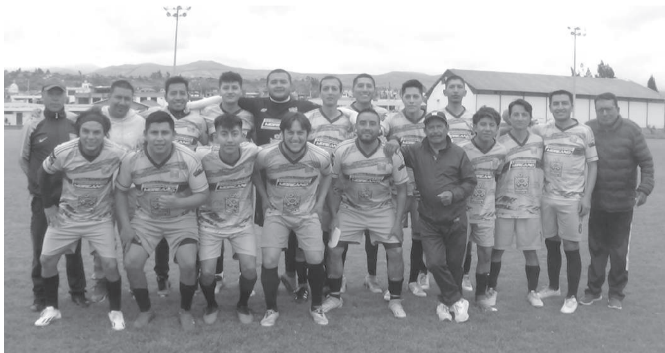
■ Solo Ramoncinos no pudo mantener su condición de local frente al difícil Defensor el Calvario de la Merced.

Estadio La Merced 10H00 PEÑAROLR VS ALIANZA SAN MARCOS 12H00 DEF. EL CALVARIO VS LA UNION