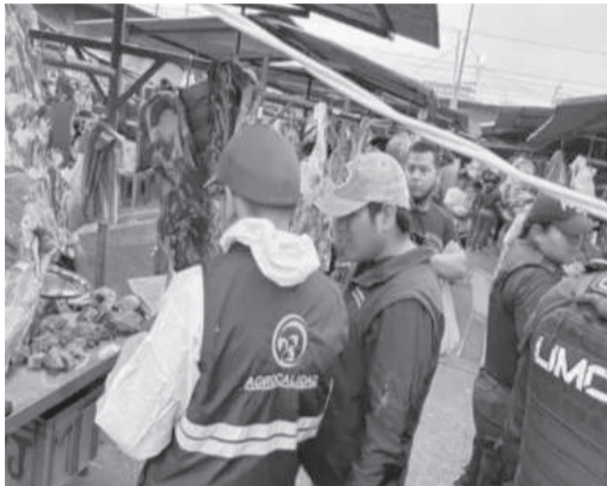
■ Comisario Nacional en el respectivo control de cárnicos

Oña señala que el día domingo se realizó un operativo con Agrocalidad para que todas las carnes que vienen del cantón La Maná provengan del camal ya que es quien clasifica si el ganado es apto para el consumo humano, incluso se encontró un porcino sin guía, se decomisaron varias piezas, al igual que un cuarto de res que no tenía guía y estaba en malas condiciones, se decomisaron 25 pollos que no cumplían con las condiciones sanitarias que se debe cumplir para