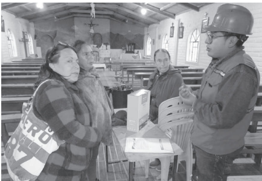
■ Instalación en el barrio.