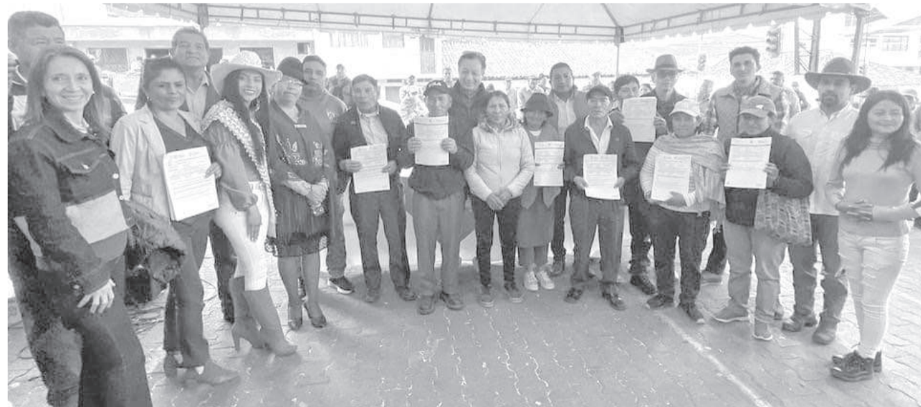
El evento se desarrolló en Sigchos.

Para el gobernador de Cotopaxi, Marco Olmedo, la entrega de estos títulos de propiedad es una muestra del compromiso con el campo ecuatoriano. "Hoy se cumplió un sueño tan anhelado para los pequeños productores, que se merecen