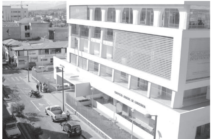
■ Involucrados irán a juicio por asociación ilícita.

Entre los lugares intervenidos se encuentran la Fiscalía de Pujilí y el Complejo Judicial de Cotopaxi, donde se hallaron evidencias como dinero en efectivo, celulares, laptops, dispositivos de almacenamiento electrónico y armas de fuego.