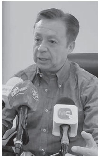
Marco Olmedo, gobernador de Cotopaxi.

los bares escolares que garantice la salud de los niños y jóvenes consumiendo alimentos de calidad, para ello, dijo que los interesados en el manejo de estos comedores deberá cumplir con los requerimientos establecidos en la norma a través del portal de compras públicas. Señaló que, ha convocado a las autoridades que tienen que ver con seguridad a una reunión a realizarse en los próximos días, para establecer un plan de seguridad que será aplicado en las diferentes unidades educativas a ser aplicado a partir del inicio del año escolar en los establecimientos con régimen Sierra y garantizar seguridad a niños, jóvenes y maestros frente a la inseguridad que está viviendo el país. Otro tema de preocupación planteado por los padres de familia, gremios educativos del sector Sierra de la provincia es la falta de autoridades educativas titulares