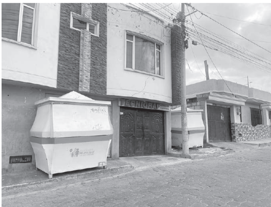
Quioscos administrados por el Patronato Municipal de Latacunga serán parte de Seguridad Ciudadana.

13 de agosto de 2024. De estas infraestructuras, algunas fueron removidas desde el centro de la ciudad hacia otros sectores y existen también los que serán parte de la dirección de Seguridad Ciudadana de la Municipalidad.