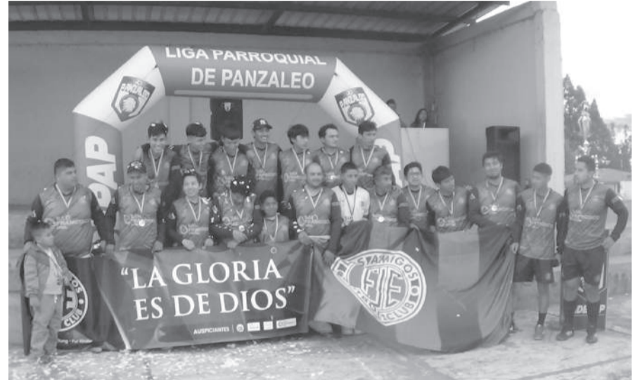
■ Los Amigos, subcampeones de Panzaleo 2024.