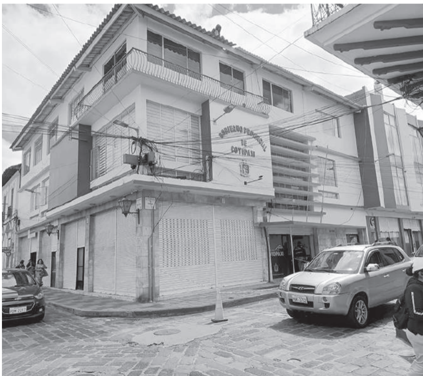
■ El Gobierno Provincial de Cotopaxi acordó recibir parte de la deuda del Gobierno en bonos.

Los bonos recibidos permanecerán grabados en la cuenta de la Prefectura por tres años, tiempo en el cual se hará efectivo, el saldo pendiente será de 12 millones de dólares.