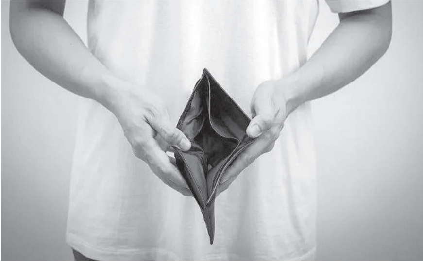
■ El hecho se registró en La Maná en el 2009.