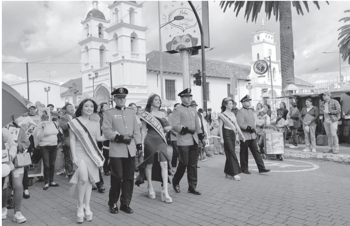
■ Las candidatas recorrieron las calles de la ciudad previo al desarrollo de la inscripción.