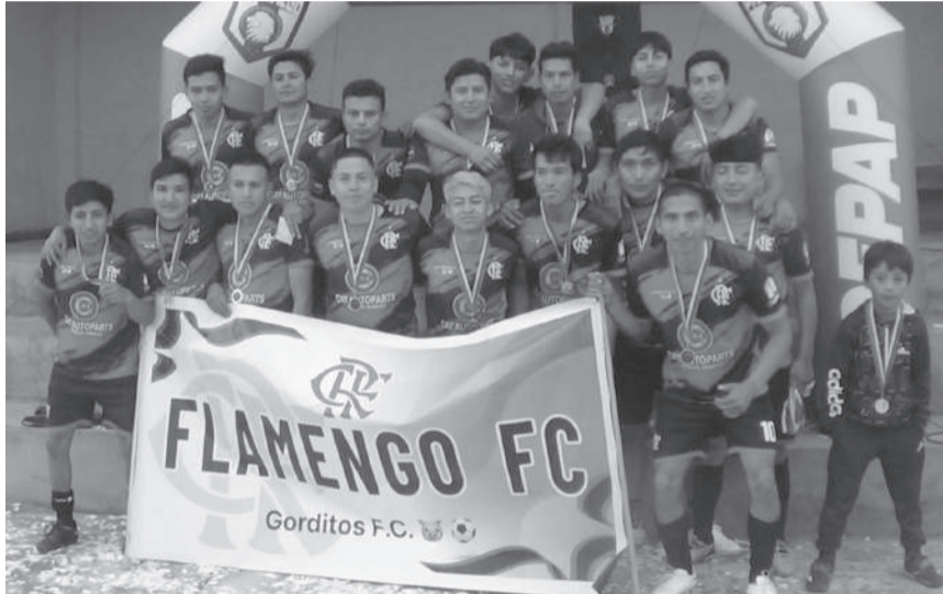
■ Flamengo, campeón de la Liga Panzaleo 2024.