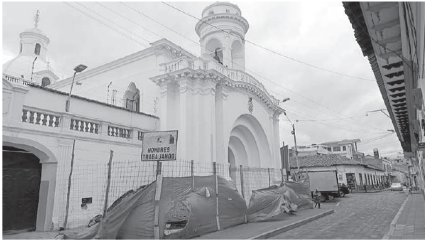
■ La intervención de la iglesia de La Merced sigue paralizado.

Desde la suspensión de los trabajos por el INPC, la intervención de la iglesia de La Merced lleva paralizada 10 meses, por segundo año, los actos religiosos por las fiestas de la imagen se cumplirán fuera del templo.