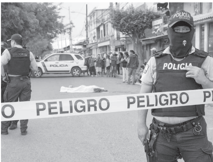
■ Autoridades nacionales presentaron datos sobre muertes violentas en el país.

14 de agosto de 2024. De acuerdo a los datos estadísticos que mantiene el observatorio ecuatoriano de crimen organizado, basado en la información del Ministerio del Interior, en 5 de los 7 cantones de la provincia se han presentado estos hechos.