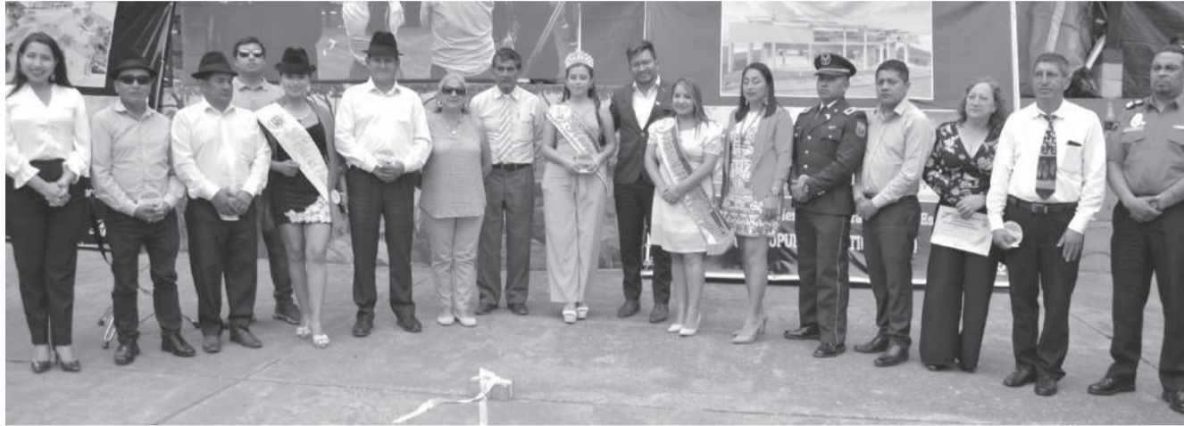
■ Autoridades del cantón y parroquia que estuvieron en la Sesión Solemne