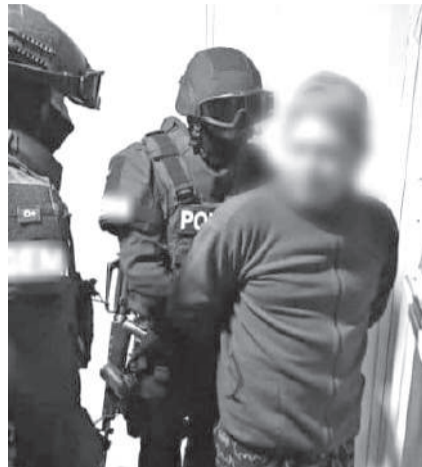
■ Desarticulan megaestructura.