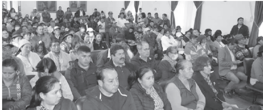
Los dirigentes de barrios y comunas presentes en la asamblea de análisis del presupuesto 2025.

La Municipalidad de Pujilí conjuntamente con los dirigentes de la cabecera cantonal o correctamente con la parroquia urbana 'Pujilí', se complace en anunciar el lanzamiento del proceso de Presupuesto Participativo 2025, una iniciativa