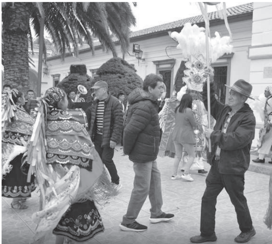
Pujilí, reactiva el turismo, cultura con los visitantes.