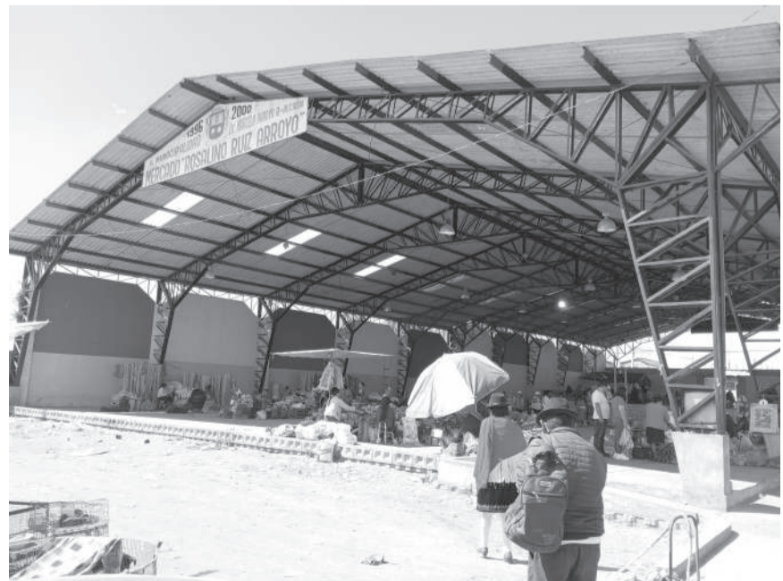
Instalaciones del mercado Rosalino Ruiz.

Resaltó que hasta el momento no se ha registrado robos o hurtos a la ciudadanía, pero sin embargo aseguro que aún se ve a los libadores por el sector, anteriormente estas personas se apostaban en las bancas que habían en el pequeño parque junto al mercado, pero ahora este parque fue derrocado para una ampliación de este mercado, sin embargo enfatizó cuando se observa algún inconveniente se ha pedido a las autoridades su presencia y enseguida acuden ya sea la comisaria municipal, los agentes de control y también la policía nacional que han ayudado para mantener el control en este sector.