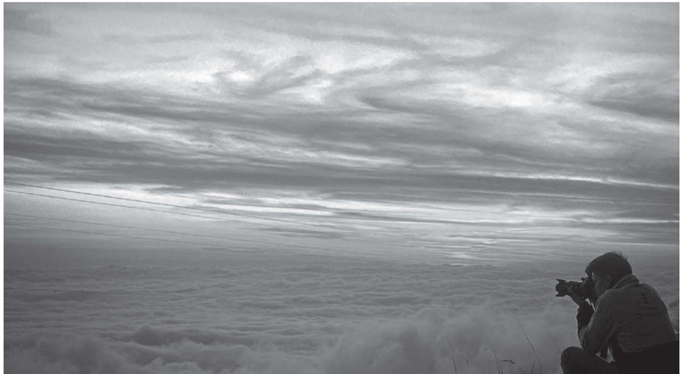
■ Vista de un atardecer en Sigchos.

A tan solo cinco minutos de la cabecera cantonal en la vía que nos conduce de Sigchos hacia la parroquia de Las Pampas, específicamente en el sector conocido como Jatunloma los paisajes y las vistas son impresionantes, las que se pueden observarse con los atardeceres de verano se debe llegar aproximadamente las 17:45 de la tarde y justo a las 18:05 se ve como el sol se termina de ocultar, varias familias que viven cerca del sector manifiestan que esto solo se mira en la época de verano y que observan como varias personas visitan diversos lugares para poder apreciar, que sería bueno que aquí se pueda tener un lugar específico para que las personas puedan llegar y observar estos bellos atardeceres y que además será un punto de llega-