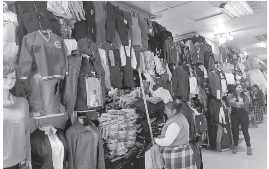
■ Negocios de venta de mochilas y uniformes para las diferentes instituciones educativas.

Dentro del año, una de las fechas esperadas por los comerciantes de prendas de vestir, uniformes, calzado, mochilas y útiles escolares es el inicio del año escolar donde las ventas suben.