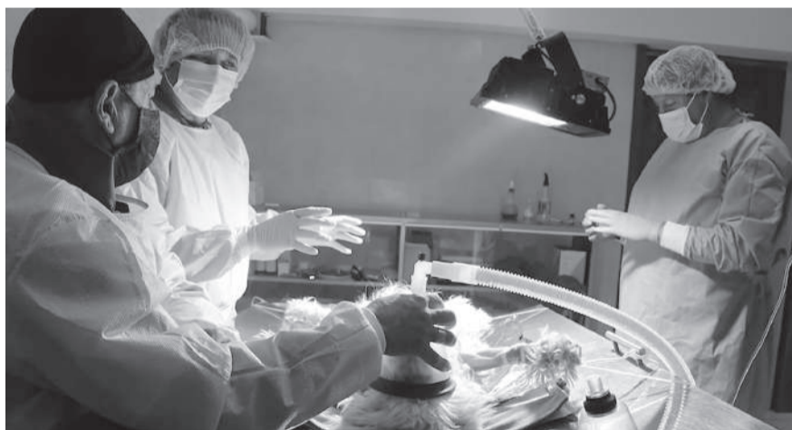
■ Durante las cirugías.