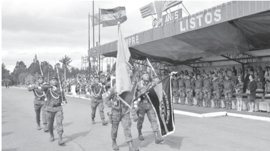
■ Ceremonia de ascenso de campaña del personal de oficiales y tropa profesional

#Latacunga | En total son 185 voluntarios y 29 oficiales. Es decir 209 uniformados en total. La ceremonia se llevó a cabo este viernes, en este fuerte militar acantonado en Latacunga.