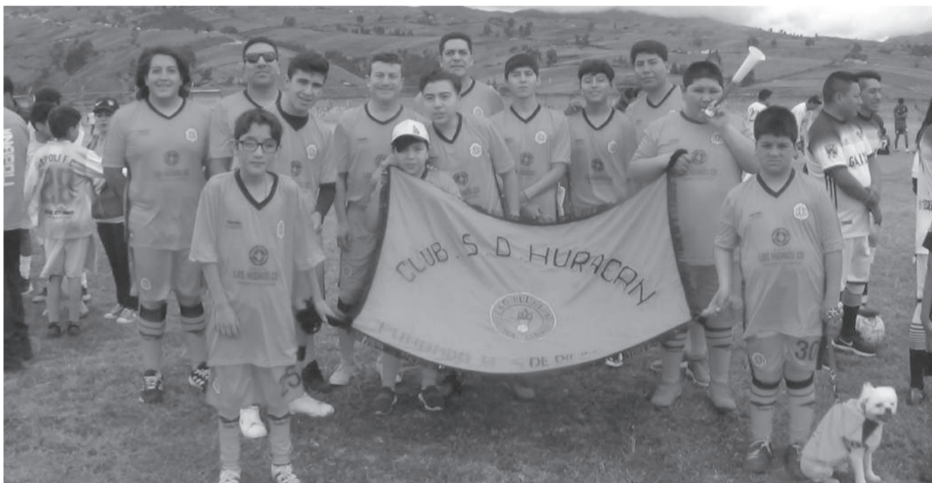
■ Huracán de Cusubamba por un título más en su rico historial.