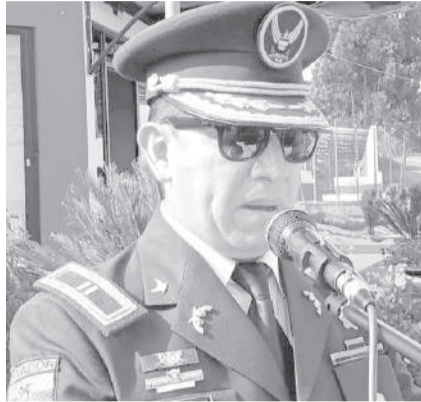
Personal policial que se suma al trabajo contra la inseguridad en la provincia.

Nelson Sánchez, gobernador de Cotopaxi, dijo que el Presidente de la República está comprometido con la seguridad del país y una muestra de aquello es la asignación de este grupo de uniformados que permitirá luchar en contra del crimen organizado, "ustedes señores policías han realizado el