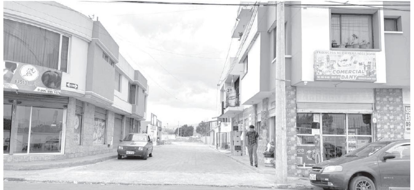
■ Autoridades incrementarán controles sobre permisos de funcionamiento.