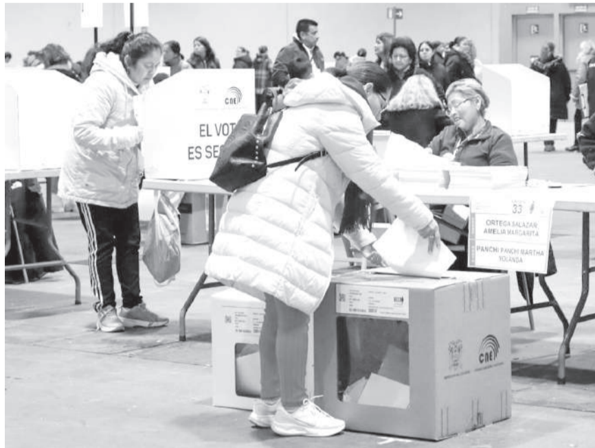
■ Elecciones seccionales será a finales de noviembre de este año.

Ese es el primer riesgo para el oficialismo, según Banda. "En lugar de transmitir orden, el cambio puede transmitir apuro. En lugar de mostrar seguridad, puede dejar