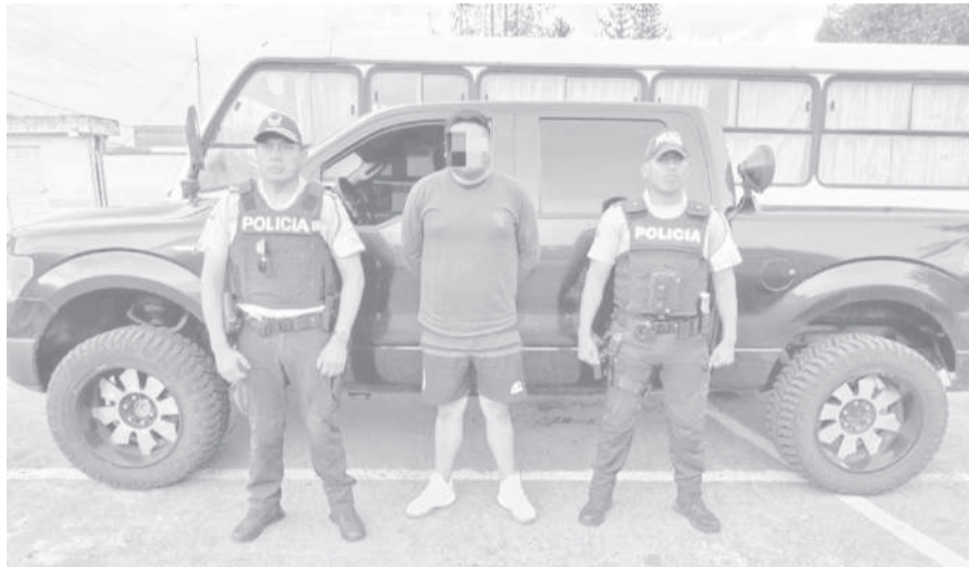
■ La policía recuperó vehículo y detuvo a una persona en Pujilí.

De manera paralela, la Policía Nacional informó que se han intensificado los