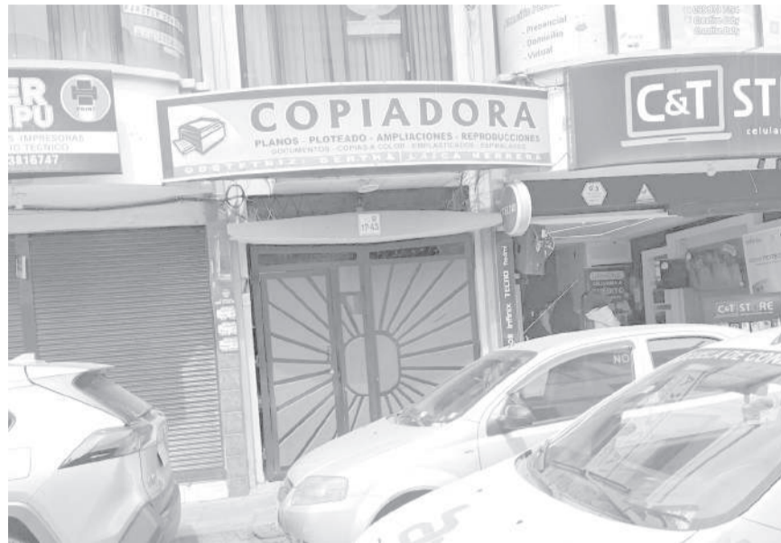
Robos preocupan a comerciantes.

Hace unos meses en ese mismo sector (calle Quito y Guayaquil) el mismo local fue víctima de un asalto y robo. En ambas ocasiones los antisociales se llevaron equipos tecnológicos. Los comerciantes están preocupados y sienten temor, incluso cierran sus locales más