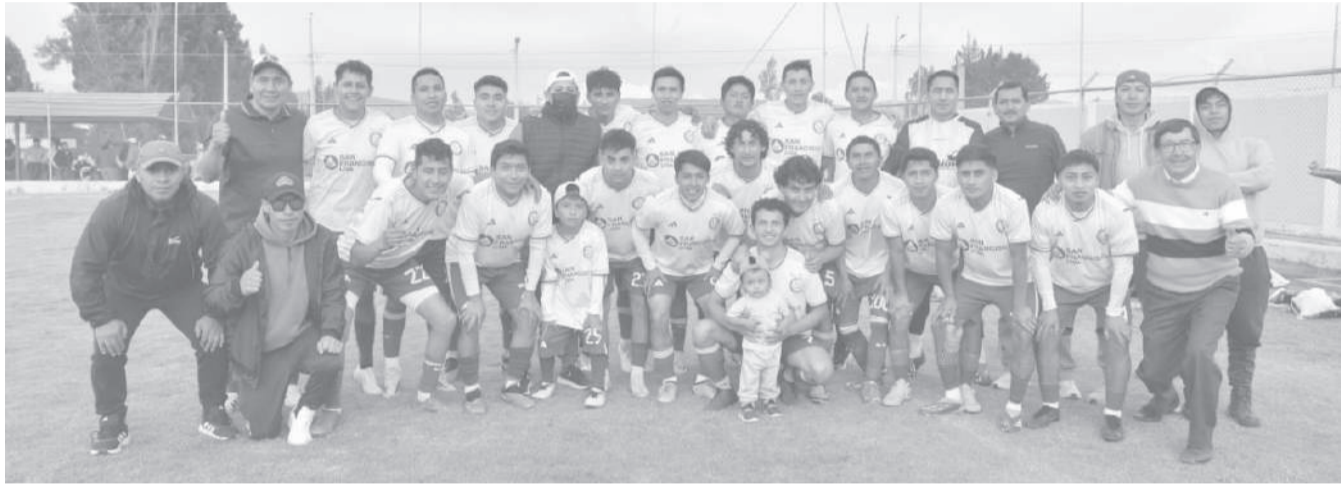
La organización del campeonato premio a los mejores, aquí lucen los campeones.