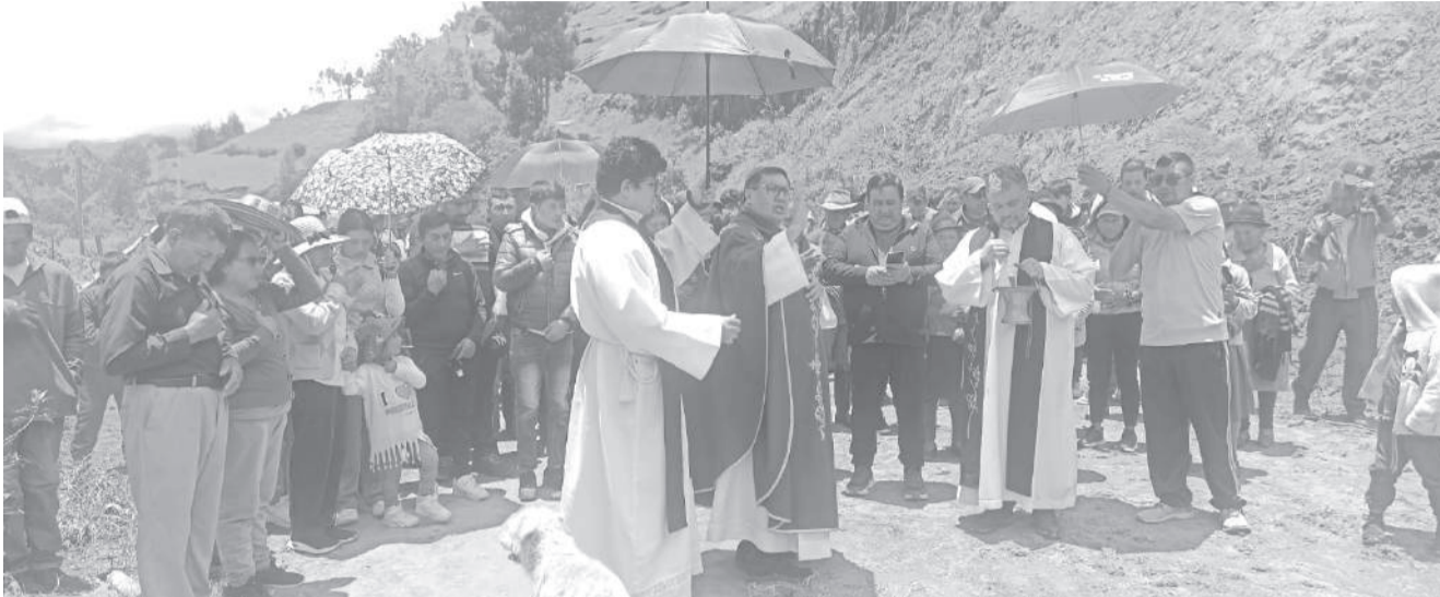
El obispo de la Diócesis de Latacunga realizó una misa en la zona cero del desastre en Sigchos.