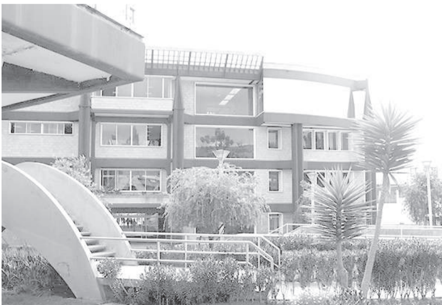
La carrera se abrirá desde octubre de 2026.