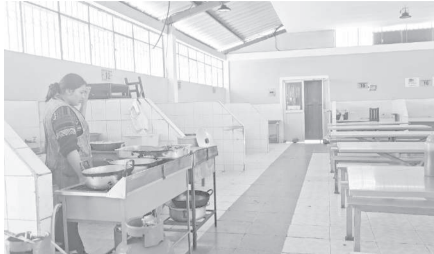
■ Mercado de la parroquia de Tanicuchí.