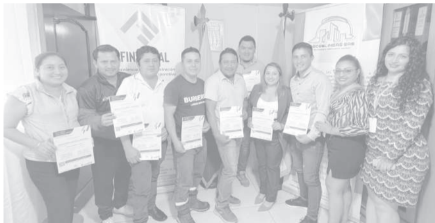
■ Autoridades y asistentes a la capacitación en el subtrópico de Pujilí.

Este proceso formativo contó con el respaldo y la acreditación oficial del