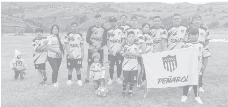
■ Peñarol lejos de las campañas de años anteriores.

campanas casi idénticas: seis victorias, un empate y tres derrotas. Sin embargo, el cuadro de Palmeiras marca diferencia en el gol diferencia (+16), producto de un ataque demoledor que suma 42 goles, el más efectivo del torneo hasta el momento. Muy cerca se ubican Alianza Juvenil y Napoli, ambos con 18 unidades, manteniéndose al acecho de los líderes. Mientras tanto, Boca Junior y San Antonio, con 16 puntos, aún conservan posibilidades de escalar posiciones en una tabla que se muestra apretada en la zona media.