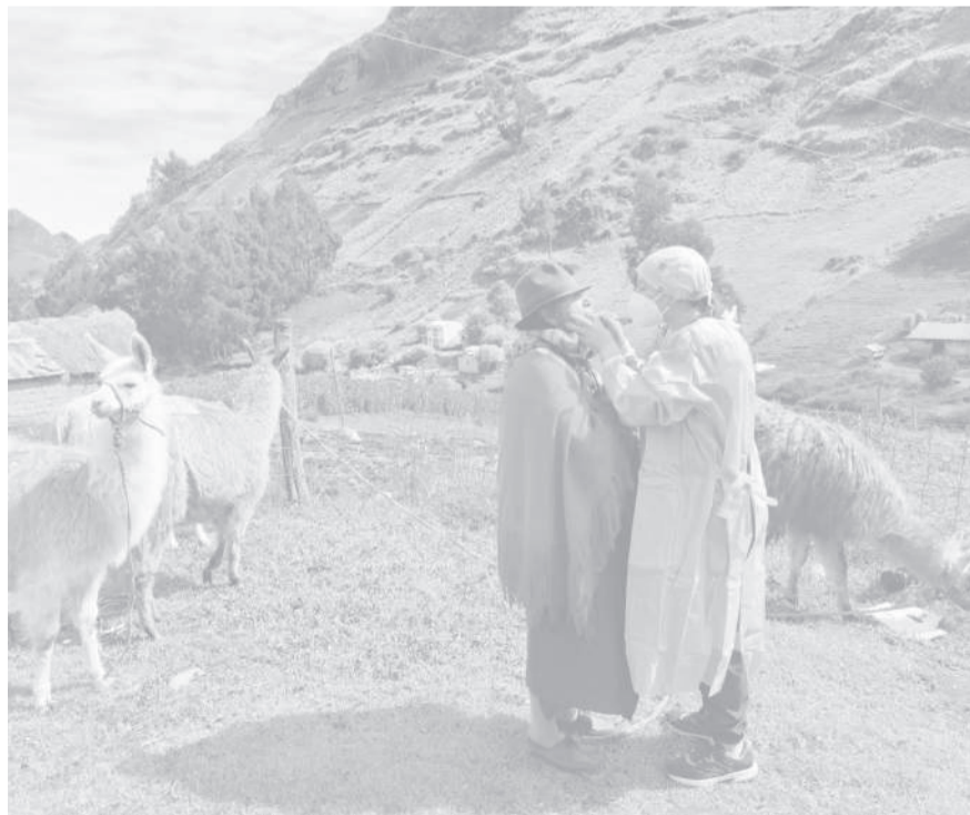
■ El personal médico atiende a la población del páramo del cantón Pujilí.

Estas acciones permiten garantizar la prevención, el acceso oportuno a servicios de salud de calidad y la promoción de hábitos saludables en la comunidad, contribuyendo al