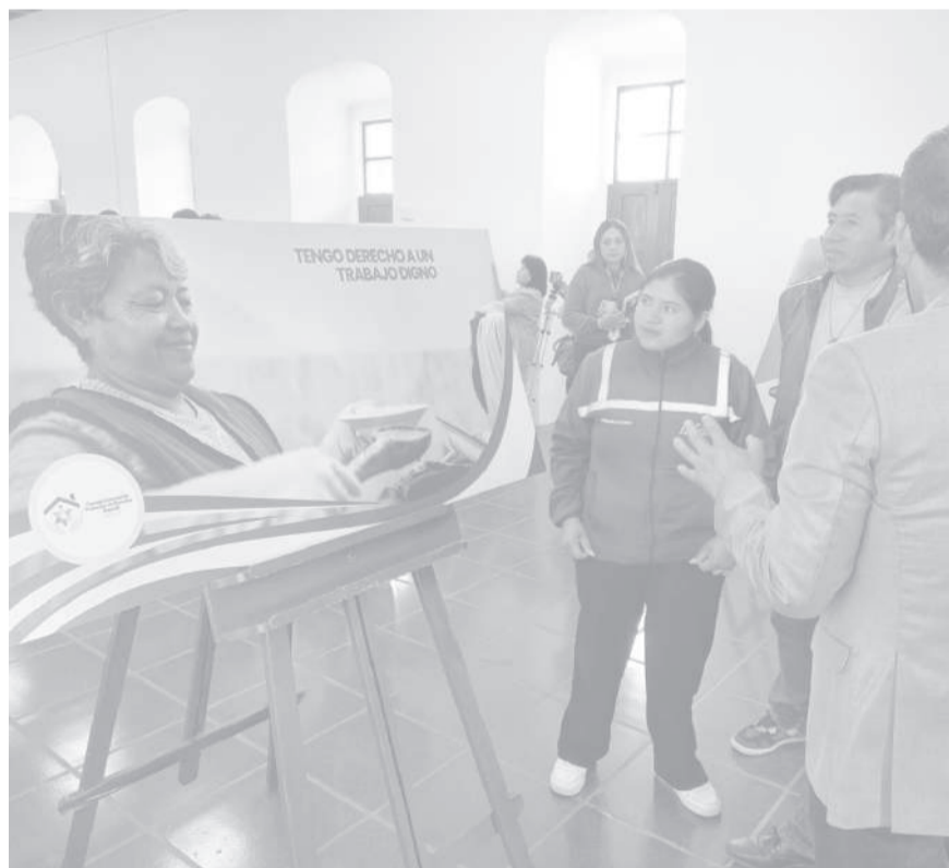
■ Durante el evento.