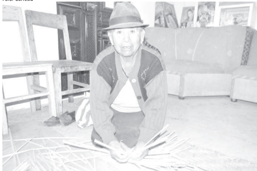
Las artesanías más conocedoras son aquellas que aprendieron de sus padres, la tradición es milenaria.

#Latacunga, El número de familias que se dedican a realizar artesanías en totora cada día disminuyen y sustituyen la actividad por el comercio o agricultura.