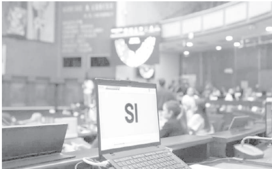
Asamblea Nacional aprueba Ley de Educación Financiera.

El proyecto establece, la inclusión progresiva y transversal de la educación financiera desde la educación inicial hasta la superior. Además, contempla a jóvenes, adultos y adultos mayores con escolaridad inconclusa, así como procesos de formación no formal.