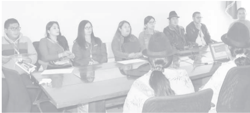
■ Representantes de salud y municipalidad presentes en la reunión.