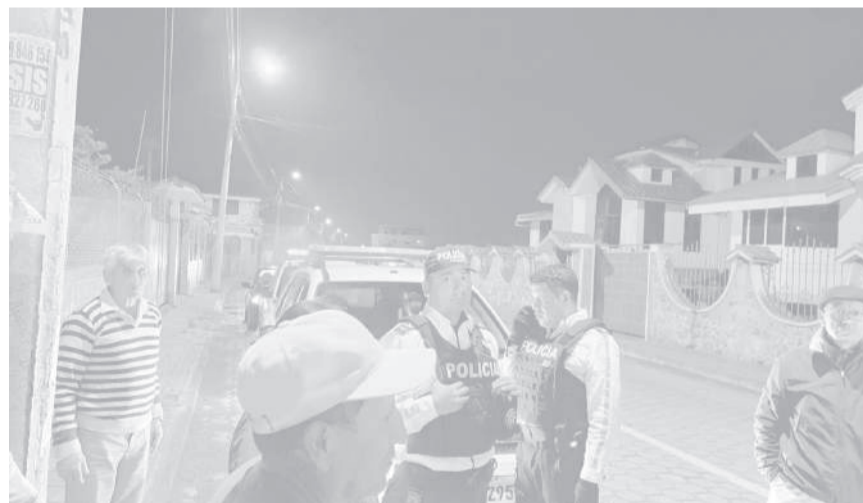
■ La presencia policial por la ciudad de Pujilí.