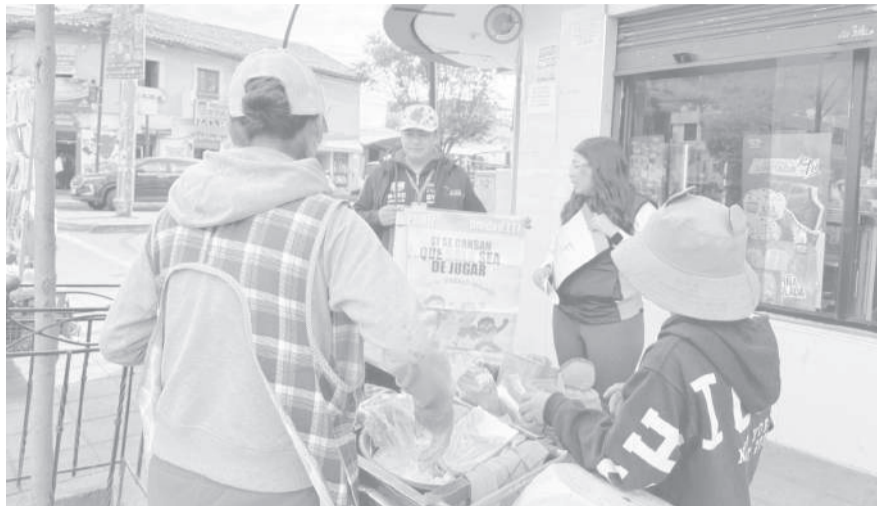
■ En la ciudad de Pujilí dijeron 'No al trabajo infantil'.