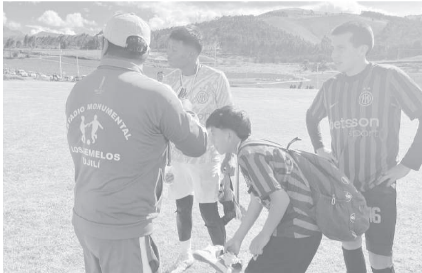
Tras finalizar el campeonato en el acto de premiación.

La final de la Copa "Blasco Yasig", disputada en el estadio monumental "Los Gemelos", en el sector San Antonio, al sur del cantón Pujilí, dejó emociones, controversia arbitral y una resolución inédita acordada entre dirigentes. El torneo, organizado por el Centro de Formación de Sabiduría Ancestral "Los Herederos de la Pachamama", inició en 2025 y concluyó en abril de 2026 con la participación de 24 clubes de distintas comunidades, consolidándose como un campeonato barrial concurrido del sector. Según, Blasco Yasig, organizador del campeonato, detalla: "Por el tercer lugar se enfrentaron los equipos Spencer con el Inter de Milán, cotejo que terminó con el triunfo del club Spencer por el tercer lugar con incentivo económico, mientras que Inter de Milán se ubicó en la cuarta casilla, recibiendo trofeo y más 20