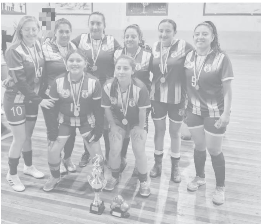
■ Brasilia Femenino y un logro indiscutible en el fútbol sala.

Con estos resultados, Brasilia no solamente reafirma su condición de uno de los clubes más representativos y tradicionales del cantón Pujilí, sino que además obtiene el derecho de representar a la liga barrial en los torneos interligas organizados por la Federación de Ligas Barriales y Parroquiales, competencias en las que buscará extender su dominio deportivo a nivel cantonal.