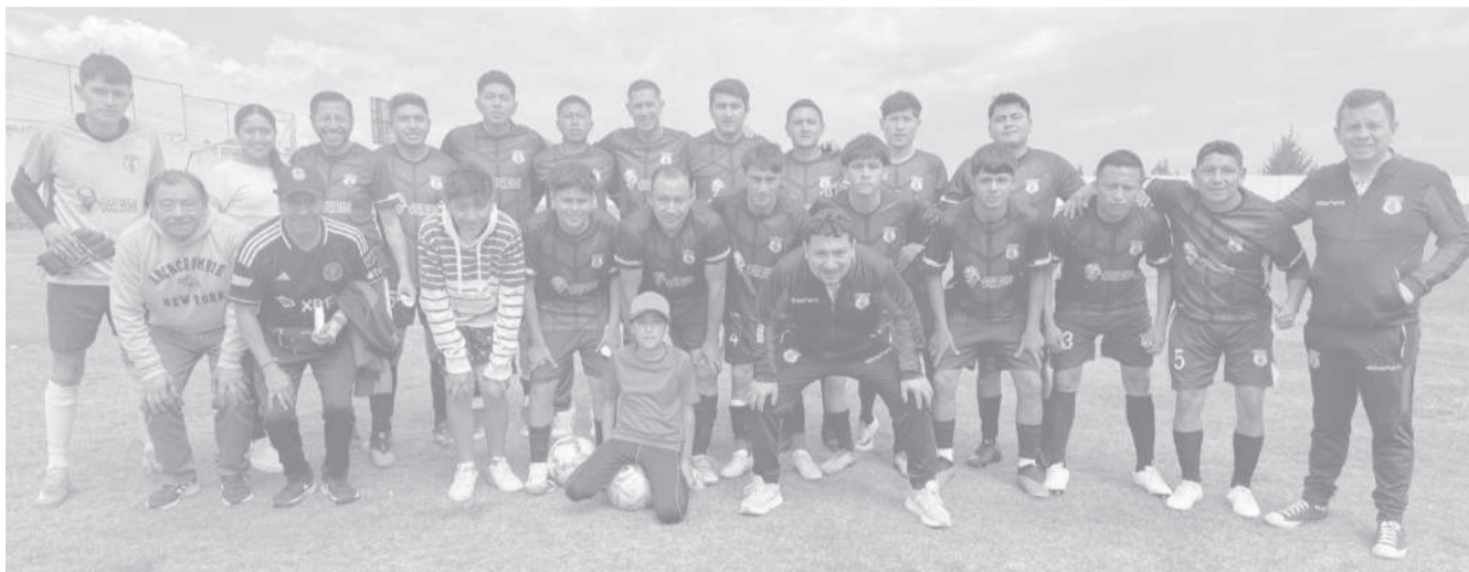
■ Brasilia el club más laureado del fútbol pujilense, suma un título más en su rico historial de éxitos.

Las jornadas definitivas estuvieron marcadas por el entusiasmo del público que acompañó masivamente los encuentros finales, en los que se evidenció un elevado nivel competitivo entre los equipos participantes. Sin embargo, fue Brasilia el conjunto que terminó imponiendo condiciones gracias a un plantel sólido, experiencia deportiva y regularidad durante todo el campeonato. En el torneo de fútbol sénior masculino, considerado uno de los