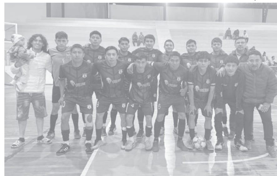
■ En fútbol sala masculino consiguió el título; un éxito celebrado de la Liga Pujilí.