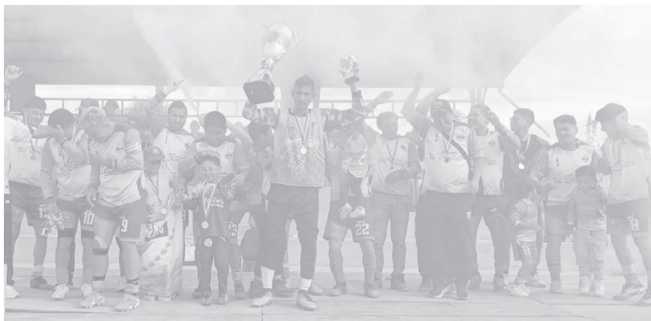
■ La Premiación a El Carmen como monarca del futbol de la Liga Oriental de Latacunga.

La programación se desarrolló en medio de un ambiente festivo y de alta expectativa, donde los equipos protagonistas demostraron entrega, buen nivel futbolístico y un marcado espíritu competitivo en busca de alcanzar la gloria deportiva dentro del balompié barrial de la ciudad de Latacunga. La primera gran definición de la jornada correspondió al campeonato de fútbol sala masculino, torneo que tuvo partidos intensos y un elevado ritmo de juego. En la gran final, el representante de Hermano Miguel mostró solidez colectiva y efectividad para proclamarse campeón del certamen. El cuadro campeón logró cerrar una destacada campaña y se convirtió en el mejor equipo del torneo, superando a Boca Junior, que se quedó con el subcampeonato. Mientras tanto, El Carmen alcanzó el tercer lugar y Newcastle finalizó en la cuarta. Posteriormente, la atención se trasladó a las finales del campeonato senior masculino, donde se disputaron encuentros de gran intensidad y dramatismo. En la categoría principal de la liga, el