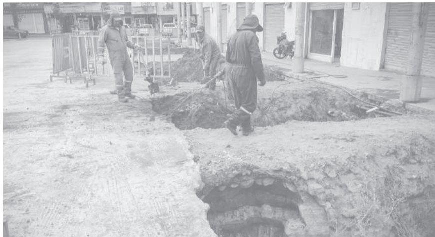
■ Obreros municipales tapan los huecos al sur de la plaza 'Sucre'.

La intervención ejecutada en la plaza 'Sucre' de la ciudad de Pujilí, responde a un proceso técnico de mitigación de riesgos, desarrollado con el objetivo de precautelar la seguridad y el bienestar de la ciudadanía que diariamente transita, comparte y realiza distintas actividades en este emblemático espacio público de la urbe.