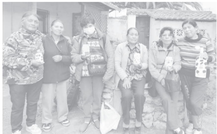
■ Participantes en actividades recreativas y artísticas en Pujilí.

Los organizadores señalaron que estas iniciativas buscan aportar al bienestar integral de la comunidad, promoviendo actividades que contribuyan a la paz emocional, la unión y la construcción de entornos más solidarios.