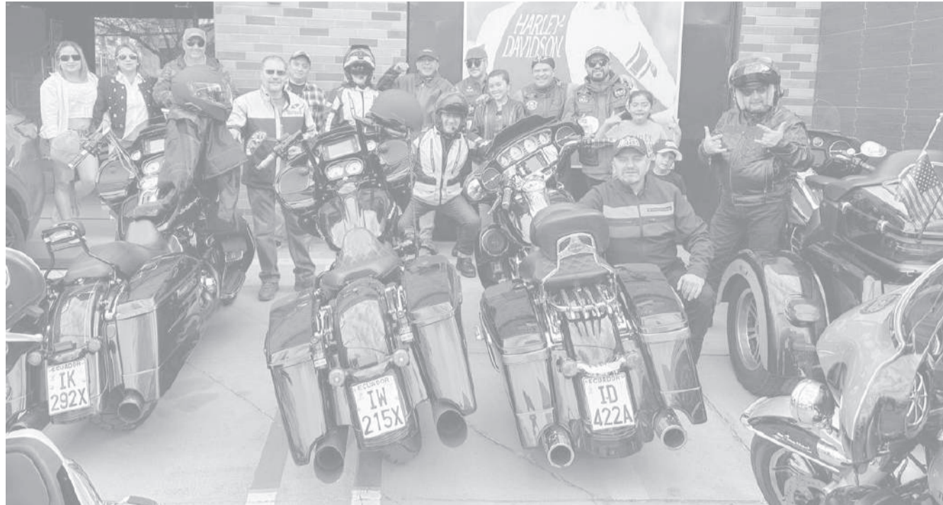
■ Miembros del Harley Owners Group.

Hemos estado aquí en algunas navidades para hacer la entrega de caramelos a los niños, no solo es la pasión de las motos sino