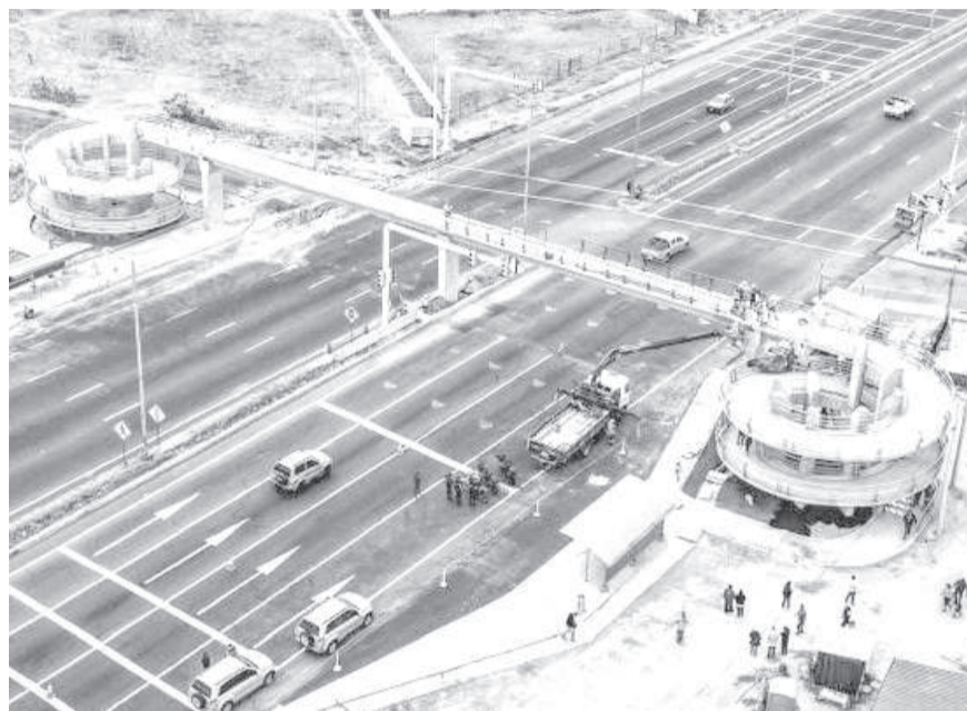
■ Construcción de paso peatonal sobre la E35 avanza.