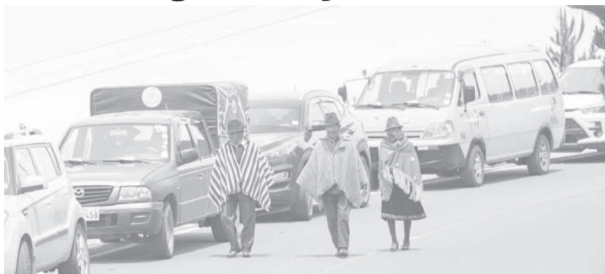
■ La vialidad es prioridad en la E-30 especialmente desde Pujilí a La Maná.

Inicialmente, la proyección económica del proyecto no superaba los 100 millones de dólares; sin embargo, de acuerdo con informes del entonces ministerio de