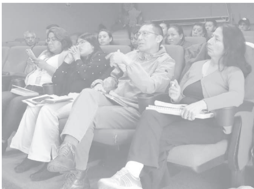
■ Varios de los asistentes a la capacitación del MSP.

La jornada contó con la participación de delegados de diferentes áreas estratégicas, quienes analizaron mecanismos de articulación y coordi-