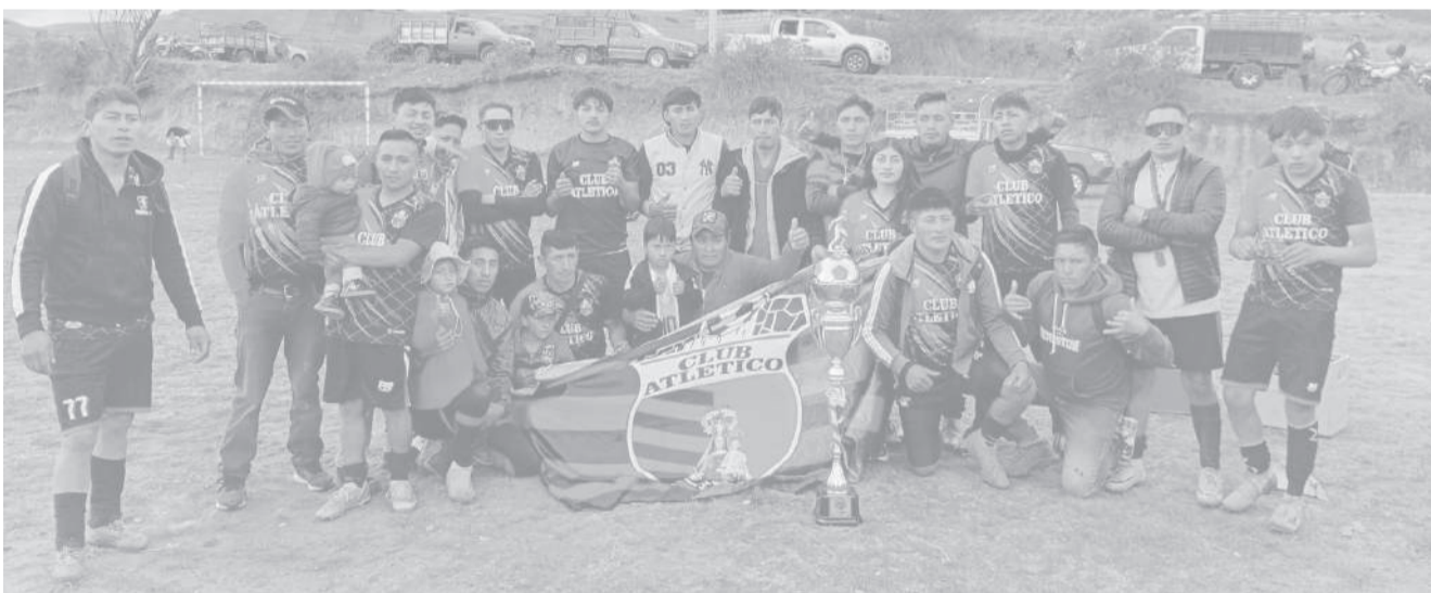
■ Atlético conquista la corona de campeón del fútbol comunitario de Sacha, sector Oriental de Salcedo.