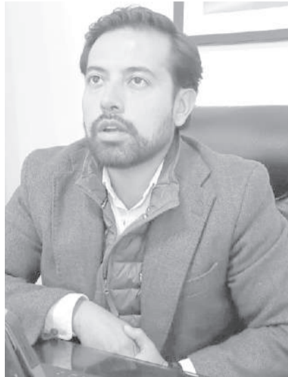
■ Jorge Baño, gobernador de Cotopaxi.

En los kilómetros 88 y 91 de la vía E30 se registraron deslizamientos de tierra que interrumpieron el tránsito vehicular por varias horas. Pasadas las 22:00, la carretera fue habilitada parcialmente. Además, durante los 15 días de toque de queda en La Maná se registraron 90 detenidos.