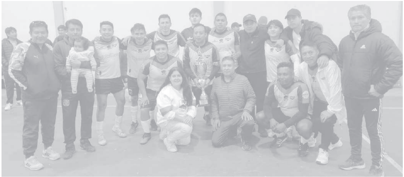
■ PSD logra el campeonato de fútbol sala de la Liga Saquifracia 2026.

Una final cargada de emociones, goles y dramatismo se vivió en el campeonato de fútbol sala de la Liga Saquifracia de Saquisilí, donde el conjunto de PSD alcanzó el título de campeón tras imponerse en la definición por penales al representativo de Alecus, que terminó quedándose con el subcampeonato.