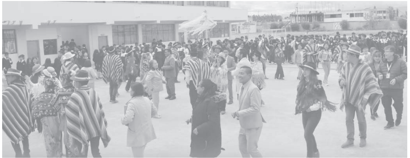
Las autoridades de la unidad educativa 'Inés Cobo Donoso' fueron jochadas por la municipalidad.