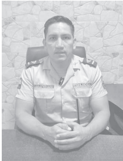
El mayor Edison Pazmiño, jefe del Distrito de Policía Salcedo, informó detalles sobre la muerte violenta registrada en la parroquia Cusubamba.

El mayor de Policía Edison Pazmiño, jefe del Distrito Salcedo, informó que personal policial acudió inmediatamente al sitio y confirmó que se trataba de un ciudadano victimado con arma de fuego. Según las primeras investigaciones, la víctima no sería oriunda de Salcedo y habría sido trasladada desde Ambato hasta Cusubamba con la intención de causarle la muerte. "Tenemos información preliminar de que al ciudadano lo trajeron desde Ambato hasta un lugar apartado de Cusubamba, donde finalmente fue asesinado",