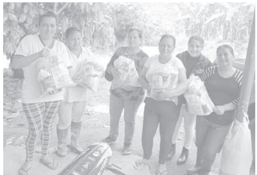
■ Ciudadanas del subtrópico de Pujilí, recibieron la ayuda de la Junta Parroquial.

El Gobierno Parroquial ratifica su labor de gestión social, llevando ayuda oportuna a los sectores que más lo requieren, explicaron.