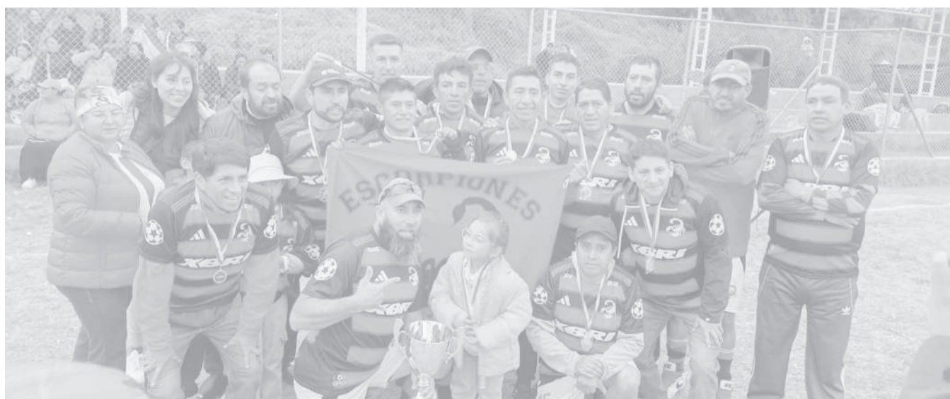
■ Escorpión Rojo en la cúspide del fútbol máster de Toacaso.

Desde el directorio organizador se destacó el compromiso de los equipos participantes, así como el respaldo de la afición. "El apoyo de los clubes y del público permitió que esta fiesta depor-