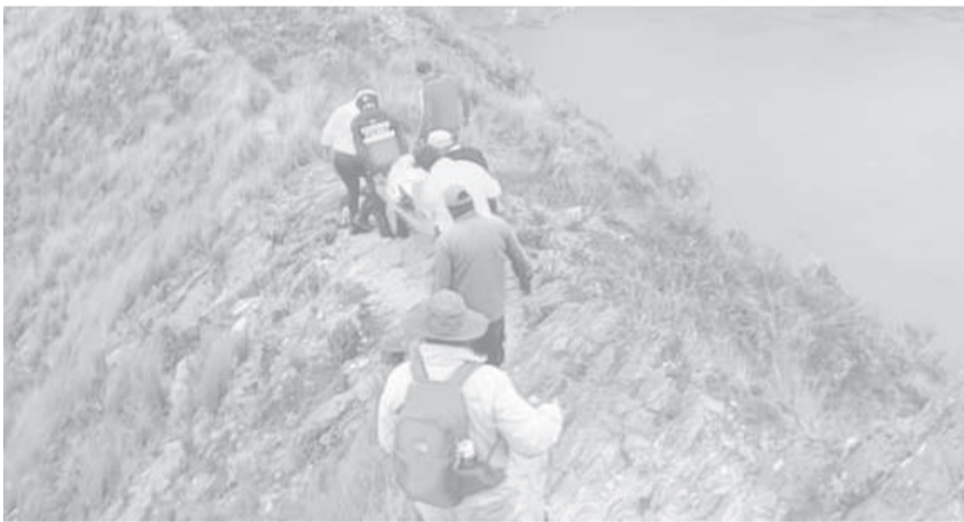
■ Miembros de Bomberos, Policía y Ministerio de Salud ayudaron en la laguna Quilotoa.