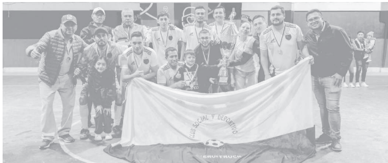
■ Servitruck conquista el trono del fútbol sala de la Liga Eloy Alfaro 2026.

El plato fuerte de la noche llegó con el enfrentamiento entre Servitruck y San José. El marcador final de 4-3 a favor de Servitruck evidenció la intensidad del cotejo, donde cada jugada fue disputada con entrega y determinación. El conjunto campeón supo imponer su jerarquía