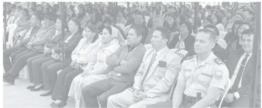
■ Representantes de instituciones educativas, municipales, policiales llegaron al acto.