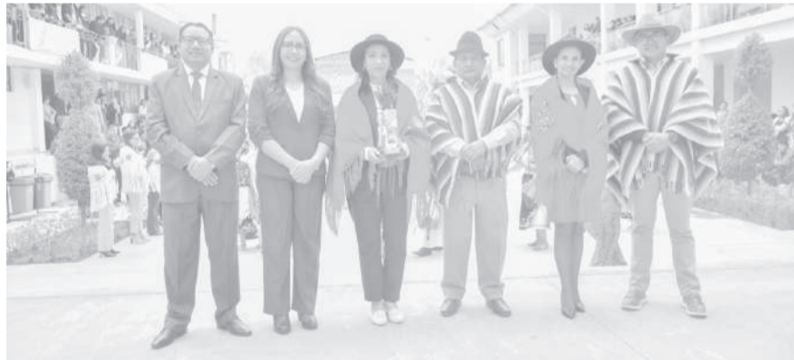
■ Las autoridades municipales y universitarias en la jocha a la UTC.