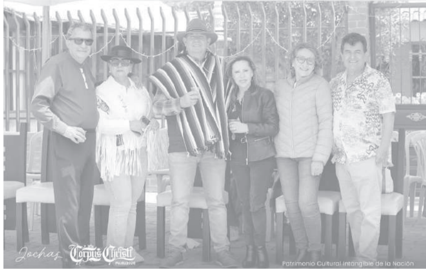
■ Los pujilenses residentes en Quito fueron jochados para la Noche Romántica.

Esta importante designación representa un reconocimiento al permanente aporte de los pujilenses residentes fuera del cantón, quienes