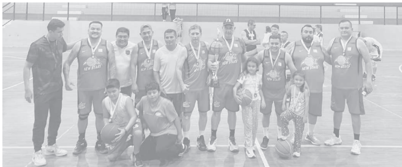
■ New Star el grande del baloncesto masculino de La Mana, esta vez campeón Master.

Previo al duelo estelar se disputó el compromiso por el tercer lugar, el club