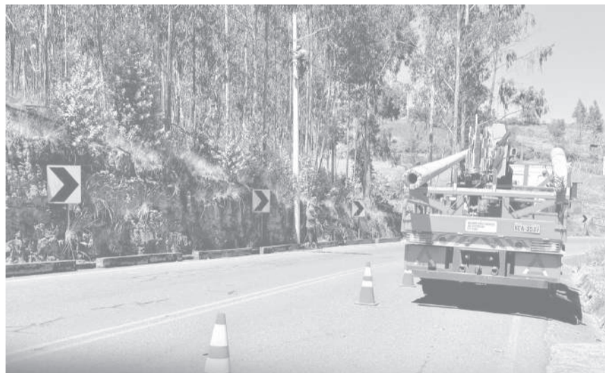
■ Técnicos y obreros mejoran la electrificación en la zona rural de Pujilí.

Las labores consistieron en el reemplazo de un poste y la renovación del cableado eléctrico, acciones que permitirán fortalecer la red de distribución y garantizar un suministro de energía más seguro, eficiente y confiable para las familias que habitan en este importante sector rural.