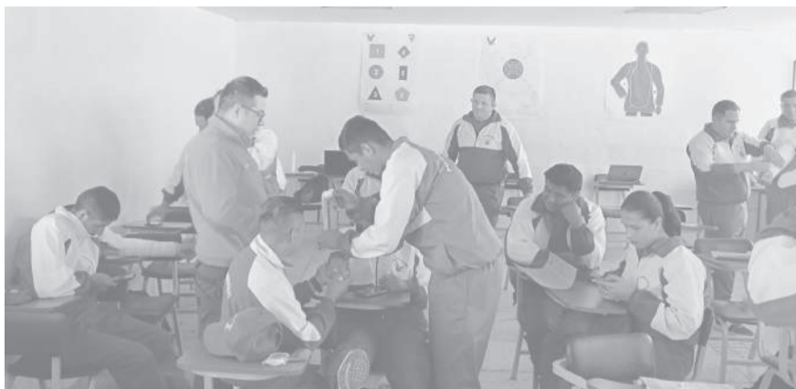
■ Bomberos capacitan a policías en el barrio 'Tres de Mayo'.

Como parte de este proceso de capacitación, el personal del cuerpo de bomberos de Pujilí imparte una serie de módulos especializados relacionados