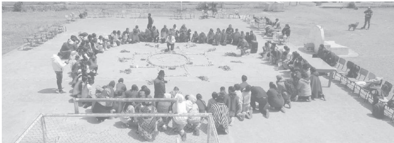
El Inti Raymi se celebró en la unidad educativa 'Juan Manuel Ayala' en Pilaló.

La jornada estuvo marcada por diversas expresiones culturales que resaltaron el significado de esta festividad ancestral andina, considerada una de las más importantes para los pueblos indígenas al representar el agradecimiento al sol, a la tierra y a la abundancia de las cosechas. A través de danzas, presentaciones artísticas y actividades conmemorativas, los participantes reafirmaron el valor de las tradiciones que forman parte de la