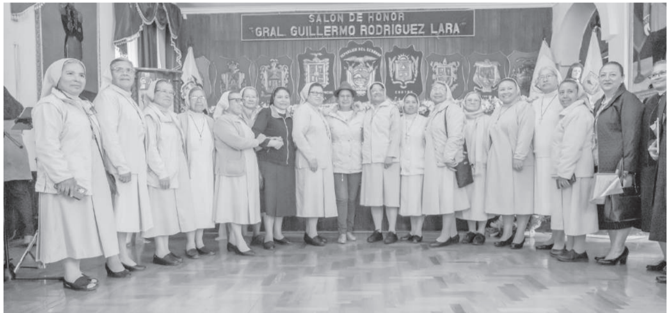
Religiosas de varias provincias llegaron a la sesión solemne en Pujilí.