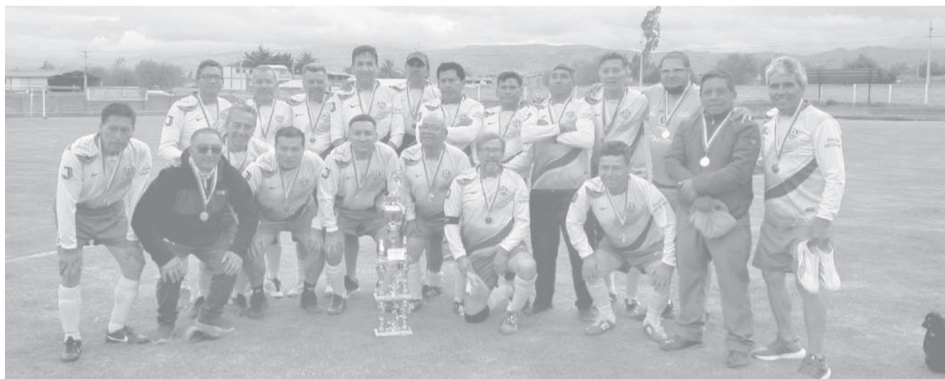
■ Juventud Saquisilense campeón del torneo de fútbol post 50 de Guaytacama.

La programación se inició con un encuentro amistoso desarrollado como parte de las festividades patronales de Guaytacama, para posteriormente dar paso a los compromisos oficiales de definición de posiciones.