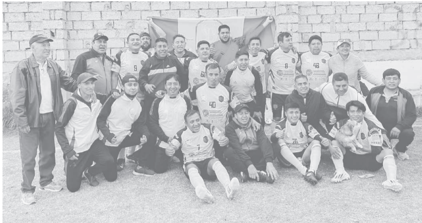
■ Bolivia de la Liga Eloy Alfaro protagonista en la categoría Máster y busca ser la sorpresa del torneo.

La categoría de veteranos tendrá actividad en la Liga Deportiva Barrial La Merced, escenario que recibirá cuatro compromisos. 14:00 Def. Calvario (LM) vs Botafogo