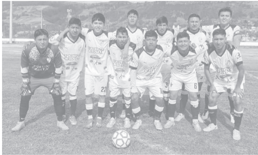
■ Sporting Cristal va en pos del título que le falta.

La jornada también dejó momentos difíciles para varios clubes. En la máxima categoría se confirmó el descenso del 26 de Julio A y Racing, instituciones que no pudieron mantener su permanencia en la serie de privilegio. La