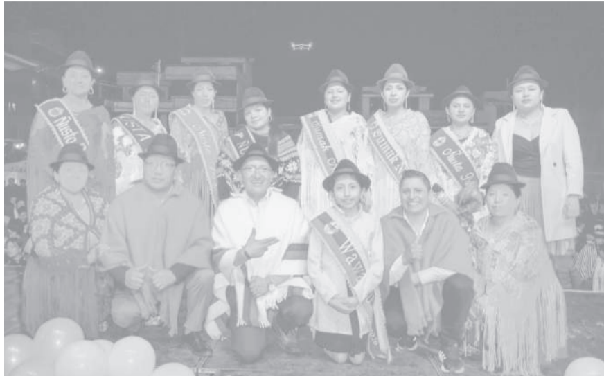
■ Las soberanas y autoridades en la parroquia Zumbahua.

El evento contó con la participación activa de todas las comunas, asociaciones, fundaciones, grupos de mujeres, organizaciones sociales y actores del sector turístico de la parroquia, quienes